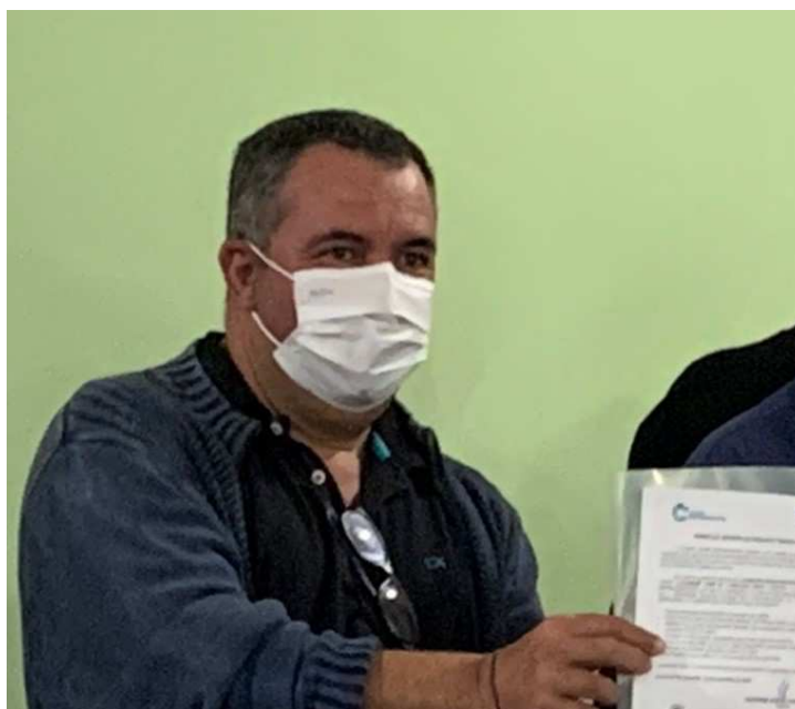
Reunião de programação do Cidades Empreendedoras