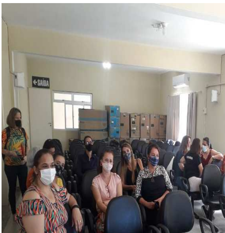
75 - Aquisição de um terreno para a construção da Escola CMEIEF : "Futuro Brilhante", localizada no distrito de Pedra Menina.