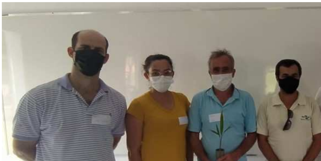
Planta 2 o de Milho Safrinha para Silagem Objetivo: fornecimento para produtores em para os torneios leiteiros.