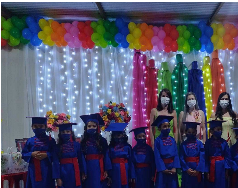
74 - Escolha das turmas para o ano Letivo de 2022 dos Professores da Educação Infantil, Ensino Fundamental I e II e Pedagogos Efetivos da Rede Municipal de Ensino.