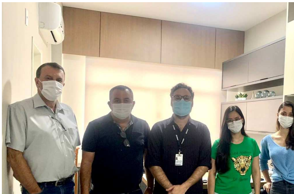
Assinatura do Convênio Cidades Empreendedoras