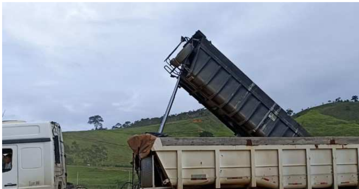
Produção de Bananas - Acompanhamento