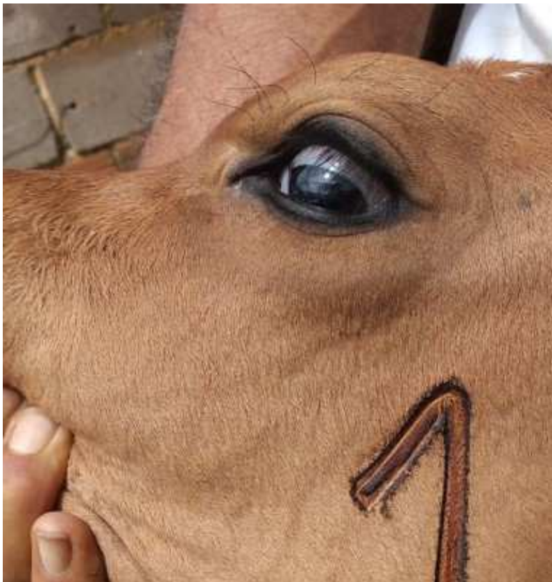
Bezerra vacinada contra brucelose