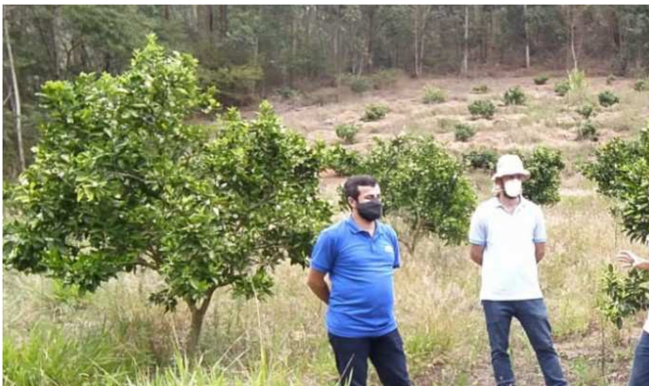
I Workshop Projeto Polo de Fruticultura do CaparaÃ